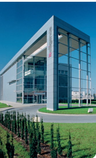
Das itelligence-Rechenzentrum in Posen, Polen.

Die Anforderungen an Ihre SAP-Systeme sind hoch: Eine gesicherte Verfügbarkeit, hohe Flexibilität und den Schutz vor Fremdzugriffen können Sie nur durch den Aufbau und Erhalt einer entsprechenden Infrastruktur und eines hohen Know-hows erreichen. Damit werden permanent personelle und materielle Ressourcen gebunden, die der Betreuung der eigentlichen Geschäftsprozesse Ihrer Unternehmung nicht zur Verfügung stehen. Warum betreiben Sie Ihre SAP-Landschaft eigentlich noch selbst?